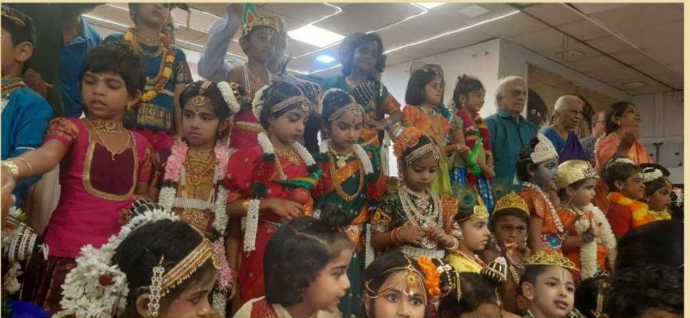
RAGHAVA NAGAR BALAVIHAR