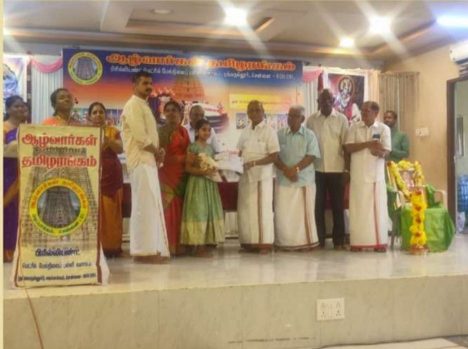
V. SHRADDHA RAGHAVA NAGAR BALAVIHAR PRIZE FOR THIRUPPAVAI RECITATION COMPETITION CONDUCTED BY BRILLIANT MATRICULATION SCHOOL