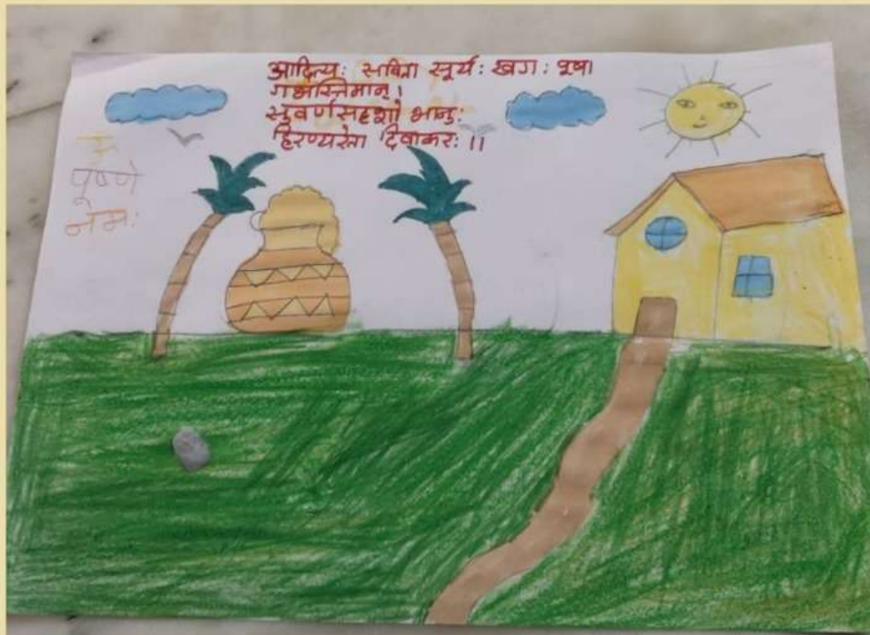
SAMARTHARAMAN 4 TH STD