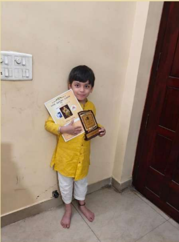
SHRAVAN, UKG RAGHAVA NAGAR BALAVIHAR THIRUPPAVAI COMPETITIONS