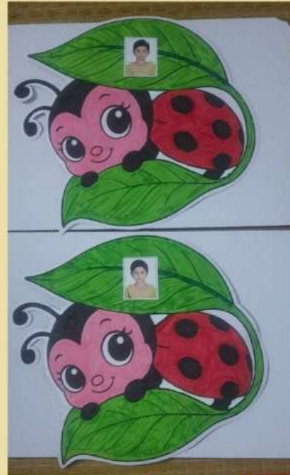
K BHAWYA K BHAVANYA RAGHAVA NAGAR BALAVIHAR