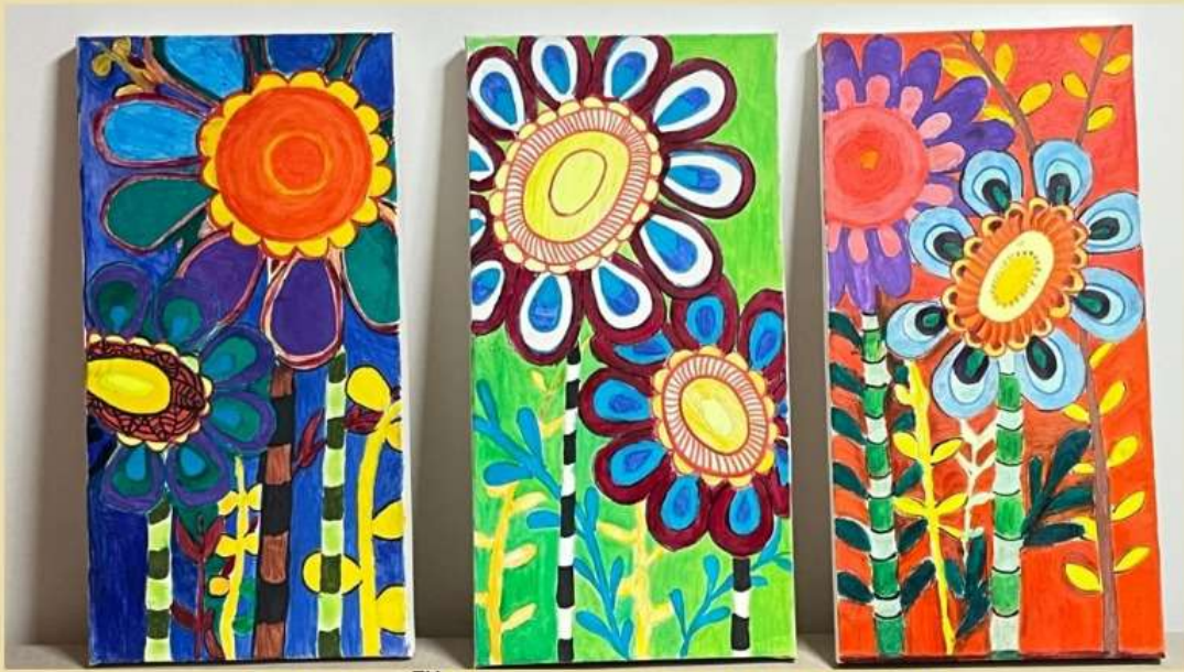
SAISHA 5 TH STD