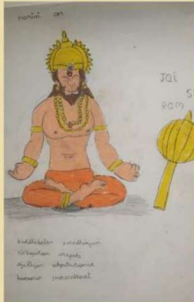
Mitrovinda Raghavanagar Balavihar