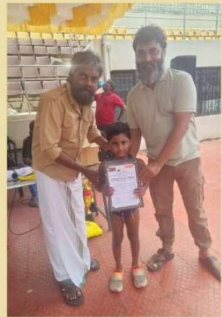
Nakul Raghavanagar Balavihar Received one gold and three bronze medals in inter school swimming competition conducted by YMCR and KIDS SPORTS PROMOTION